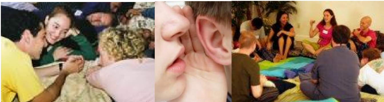
Cuddle Circles in New York und Seattle